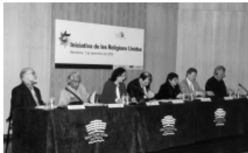
Acte de presentació a Catalunya de la Iniciativa de les Religions Unides, el dia 1 de desembre, al World Trade Center de Barcelona