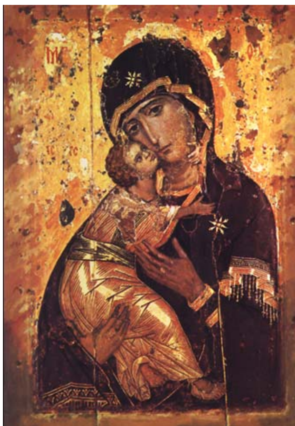
Mare de Déu de Vladimir (als voltants del 1130)

Activitat 9. Us demanem que en silenci o escoltant música ortodoxa contempleu aquestes imatges. Amb quins personatges es va inspirar? Què volia transmetre el creador? Havíeu vist abans alguna icona? On?