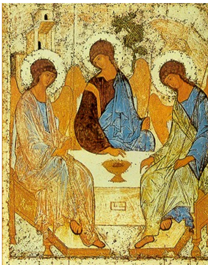
"Trinitat de l'Antic Testament" d'Andrei Rublev